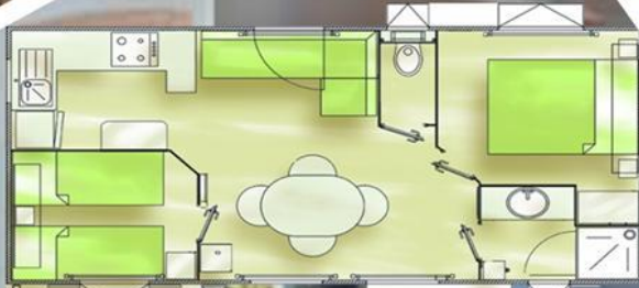
Mobil Home 31 m 2